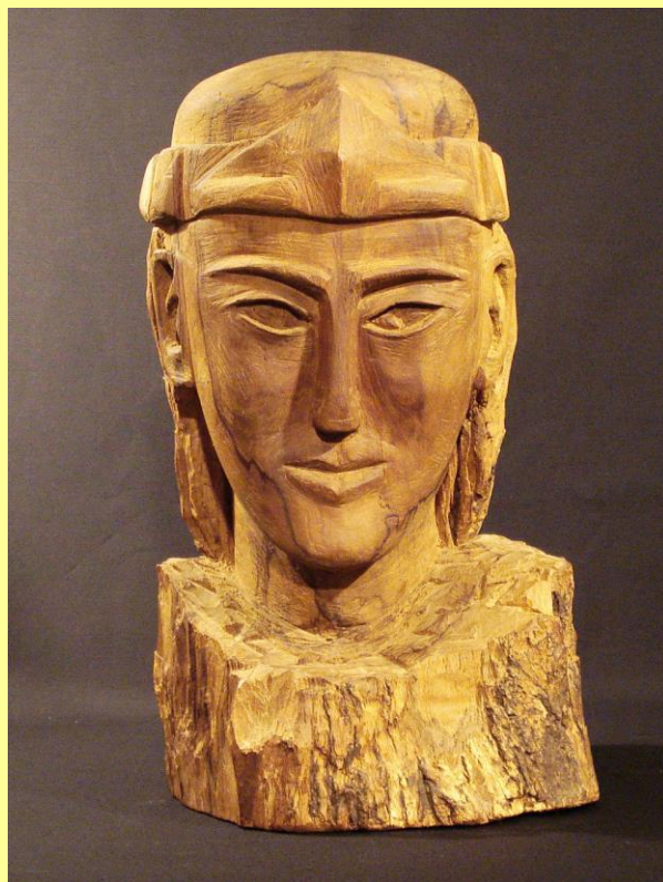
Scultura in legno di ulivo alta circa cm. 34

Attingete energia per arrivare a sussultare ed a conoscere ed a capire e comprendere le cose di tutta la creazione!